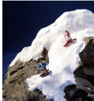
Art.Nr / article No.YW07