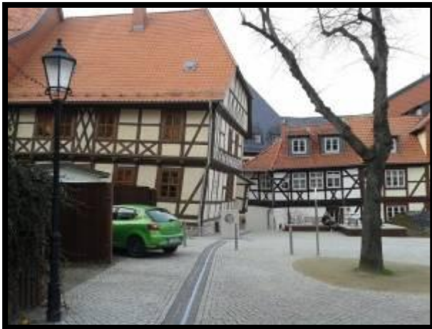
Das Schiefe Haus