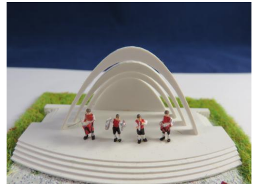
Art.Nr / article No.Z127B