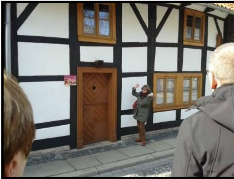
Das älteste Haus

Durch die Fußgängerzone mit Geschäften wie sie auch in anderen Innenstädten zu finden sind, kamen wir zum Marktplatz mit seinem imposanten Rathaus. Aus Stein wurde ab 1277 ein massives gedrungenes Gebäude errichtet. Um das Haus attraktiver zu gestalten und die Wichtigkeit der Stadt zu demonstrieren bekam der Unterbau ab 1492 eine Fachwerkaufstockung. 1497 wurde dann vor dem breiten niederdeutschen Giebeln zwei schlanke Fachwerkstürme gesetzt und als Gegenstück zu den vertikalen Elementen, als horizontales Band, in den unteren Gefachen „geschweifte Andreaskreuze“ eingebaut die hier zum ersten Mal in Wernigerode auftauchen, und dann in der Stadt an anderen Fachwerkhäusern übernommen wurden. Sein heutiges Aussehen erhielt das Rathaus nach dem Brand im Jahr 1521 und weitere Umbauten bis 1544. Bemerkenswert sind die geschnitzten Figuren mit denen die Geschoss- und Dachüberstände verziert sind. Es gilt heute als eines der schönsten Rathäuser Europas.