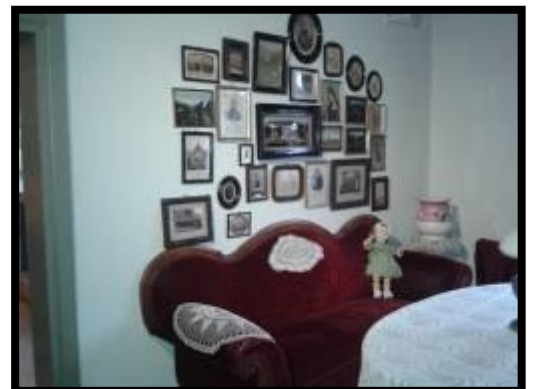
Stolberg Zimmer 19/20. Jahrhundert