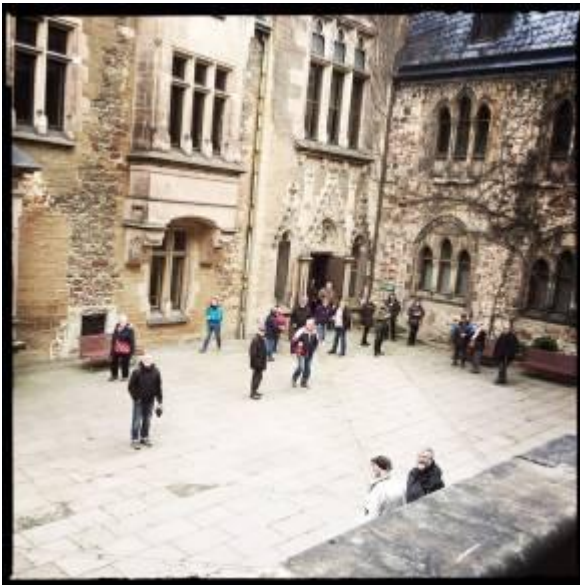
Schloss Wernigerode Innenhof