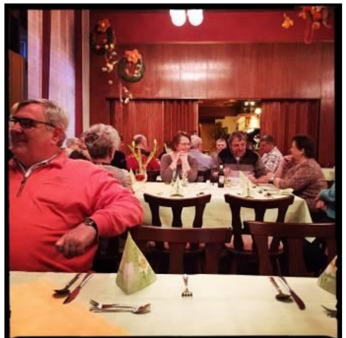
Abendessen im Hotel