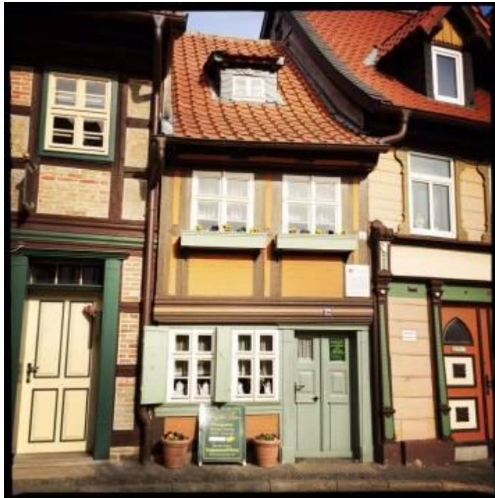
Das kleinste Haus

Zu bestaunen war noch das kleinste Haus von Wernigerode. Mit einer Breite von unter 3,0m machte es wirklich einen eingezwängten Eindruck zwischen den stattlichen Nachbarhäusern. Früher bewohnt, ist heute eine kleine Ausstellung im Haus untergebracht.