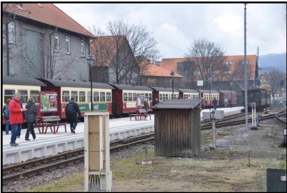
Brockenbahn im Bahnhof von Wernigerode

Unser Bus setzte uns direkt am Bahnhof der Harzer Schmalspurbahnen ab. Der Zug, der uns auf den Brocken bringen sollte stand schon bereit. Während unsere Reiseleitung die Fahrkarten kaufte, enterten die Stammtischler schon die Wagen. Die Schmalspurwagen waren zum Glück schon vorgeheizt, denn die Morgentemperatur lies noch zu wünschen übrig.