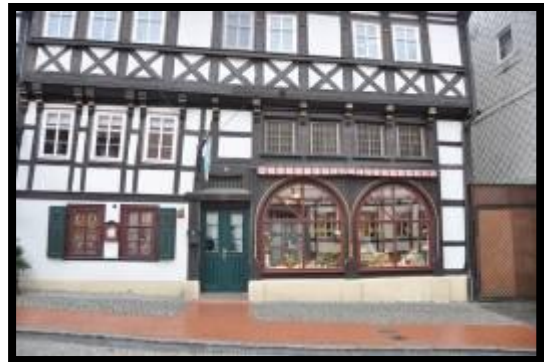
Cafe in Stolberg

Manche von uns sind sicher nicht nur wegen des Nieselregens im nahegelegenen Münzmuseum hängengeblieben. In der Alten Stadtmünze ist das Münzmuseum untergebracht. Vom Erdgeschoss bis unters Dach sind antike Schätze ausgestellt. Zu sehen sind alte Münzpressen, Prägestempel und bis zu 1000 Jahre alte Münzen. Da bekanntermaßen Münzen klein sind, und auch eine große Menge Münzen wenig Platz beanspruchen wurde der restliche freie Raum anderweitig genutzt. Zu sehen war ein alter Webstuhl, ein eingerichtetes sogenanntes Stolberg Zimmer aus dem 19. Jahrhundert, und eine Gedenkausstellung an den berühmtesten Sohn der Stadt, Thomas Müntzer. Er wurde vor 526 Jahre im Jahre 1489 hier geboren. Sein Geburtshaus stand in der Nähe des Marktplatzes. Hier erinnert heute eine Gedenktafel an den Revolutionär. Müntzer war Theologe und Reformator und hatte trotz des Namens nichts mit dem Münzwesen zu tun. Gewirkt hat er insbesondere im mitteldeutschen Raum. Erst Mitstreiter von Martin Luther, war er später dann sein Gegner. In den Bauernkriegen versuchte er die Bauern zu einigen. Im Mai 1525 wurde er in der Schlacht bei Frankenhausen gefangen genommen, gefoltert und öffentlich hingerichtet.