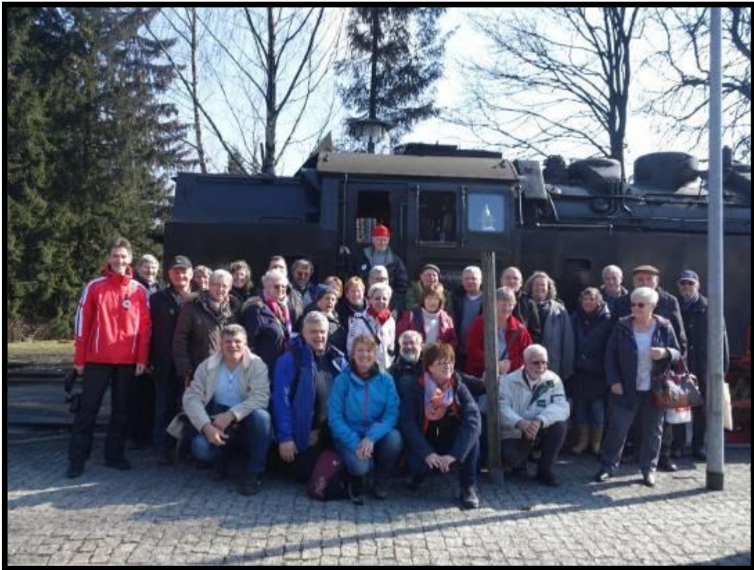
Gruppenbild mit Dampflok

Mit dem Bus ging es nun zurück nach Wernigerode. Unsere Reiseleiterin lud alle zu einer Stadtbesichtigung zu Fuß ein. Zur Einstimmung ein Zitat.