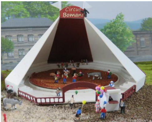
Art.Nr / article No.:Z125B