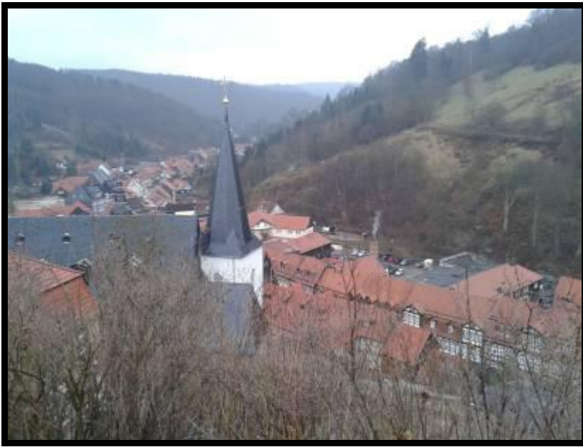
Stolberg vom Schloss aus

Unser Bus setzte uns direkt am Bahnhof der Harzer Schmalspurbahnen ab. Der Zug, der uns auf den Brocken bringen sollte stand schon bereit. Während unsere Reiseleitung die Fahrkarten kaufte, enterten die Stammtischler schon die Wagen. Die Schmalspurwagen waren zum Glück schon vorgeheizt, denn die Morgentemperatur lies noch zu wünschen übrig.