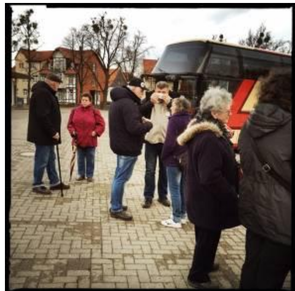
Auf dem Busparkplatz,