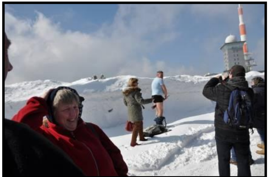
Männer Strip auf dem Brocken