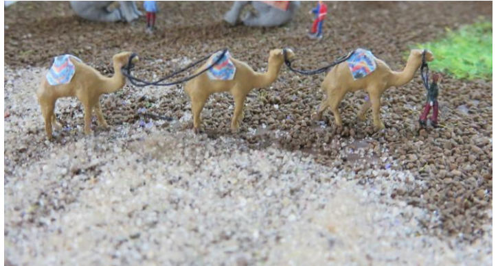
Art.Nr / article No.:TD02