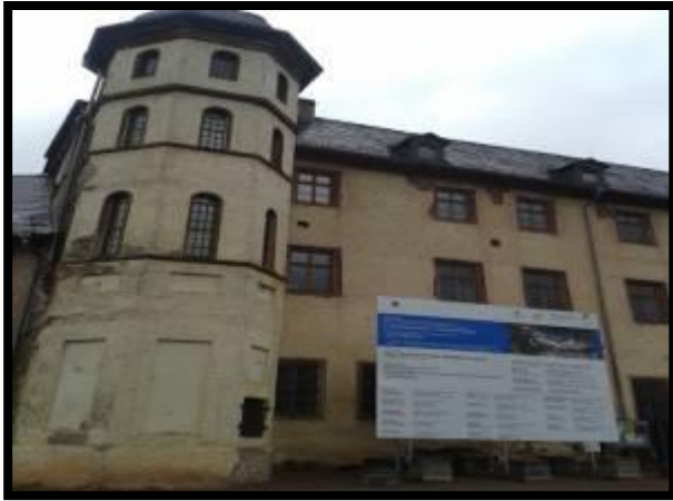
Schloss Stolberg, wird renoviert

Über der Stadt thront das Schloss Stolberg. Der Aufstieg auf den Schlossberg war schon recht beschwerlich. Es ging über ausgetretene Treppen steil nach oben. Kräftiger Wind fegte den Regen ins Gesicht. Und kalt war es auch. Zurzeit wird das im Besitz der Deutschen Stiftung Denkmalschutz befindliche Gebäude saniert. Ein Flügel kann zwar besichtigt werden, aber dazu fehlt dann doch die Zeit.