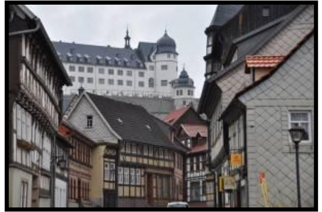
Schloss Stolberg, renoviert

Pünktlich um 18:30 Uhr wurde das Abendessen im Hotel Zum Kanzler serviert. Zur Auswahl stand als Hauptgericht Züricher Geschnetzeltes mit Spätzle oder Schweinebraten mit Klößen und Rotkohl. Zum Nachtisch wurde ein Marillenknödel mit Schokokuchen serviert. Nach dem Essen wurde noch ausgiebig geplaudert. Aber schon ab 21:00 Uhr löste sich die Gesellschaft auf. Obwohl wir im Bus gefahren worden sind, waren wir alle rechtschaffend müde und wollten nur noch ins Bett.